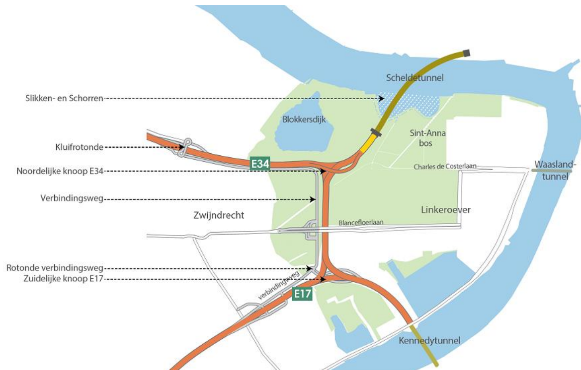
Kaartje toekomstig traject Oosterweelverbinding op Linkeroever met o.a. de noordelijke knoop E34 (=vroegere Expresweg) en de zuidelijke knoop E17. De te bouwen Scheldetunnel zal deel uitmaken van de ring rond Antwerpen ( www.zwijndrecht.be )